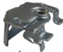
Étrier face / plafond de série