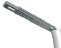
Equerre GM 150-250 mm